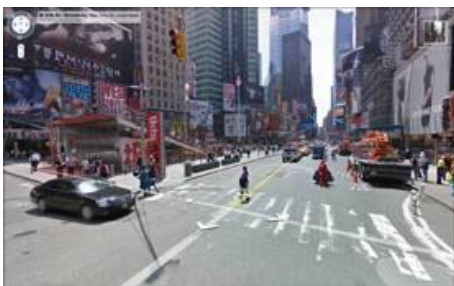
Figura 1. Street View

O Street View oferece aos usuários vistas panorâmicas, é como se a pessoa estivesse andando normalmente ao nível das ruas, tendo uma visão de 360° na horizontal e 290° na vertical. O sistema mapeia as cidades através de veículos equipados com câmeras fotográficas digitais, equipamentos de localização por GPS ( Global Position System ou Sistema de Posicionamento Global) e um disco com capacidade de armazenamento de dados, tirando fotos a cada curto espaço de tempo em uma perspectiva do pedestre (ver figura 1). O grande diferencial é que se pode passear pelo sistema, como se estivesse andando pelas ruas da cidade só que através da internet.